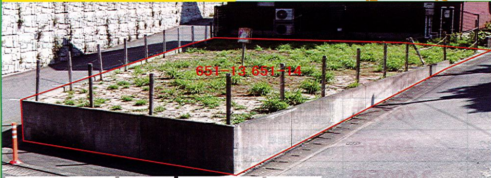
駅まで徒歩5分 平坦地 一戸建向き 三方路