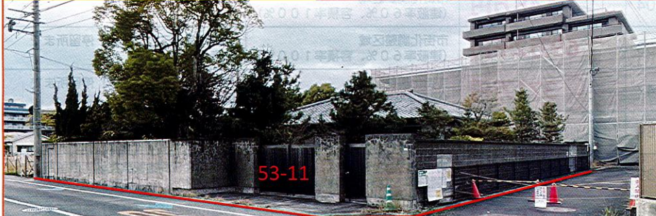
バス停まで徒歩4分 平坦地 整形地 接面道路幅員6m以上 前面道路との高低差なし